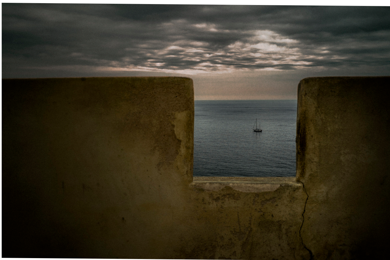
↗ The Sea Beyond the Wall, 2023 Impression pigmentaire sur papier rag satin Edition de 6 + 2 AP 2 - 30x40 2 - 40x60 2 - 75x100